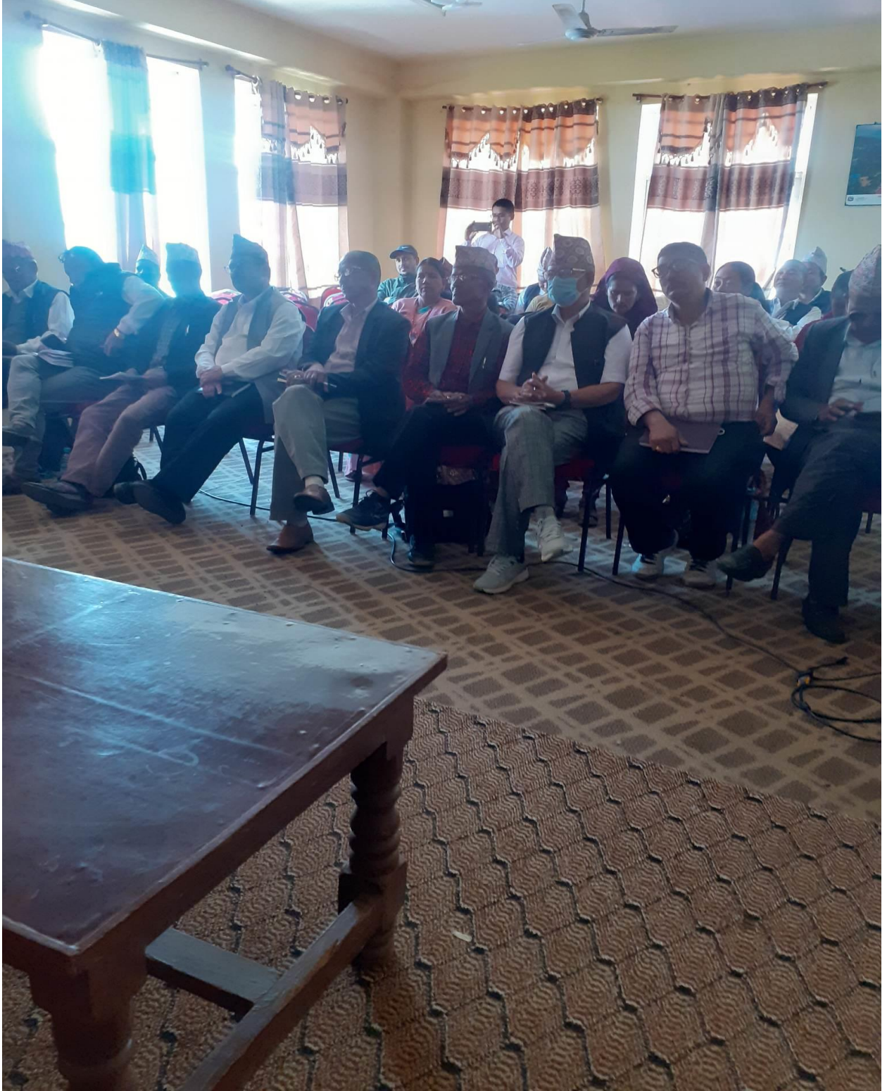
आवधिक योजना निर्माण पूर्वकार्यशाला गोष्ठीका सहभागिहरु